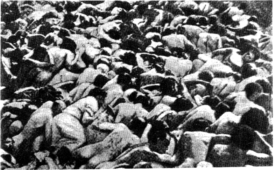
דערשאַסענע יידן אויפן 9-טן פּאַרט אין קאַוונע. ליטע 1942.